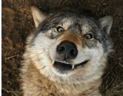
Волк съел козу