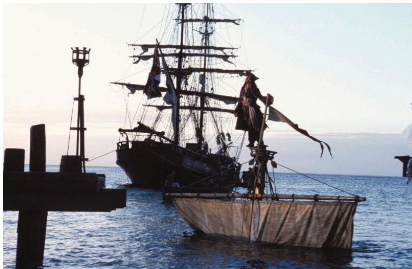
Ваша лодка затонула